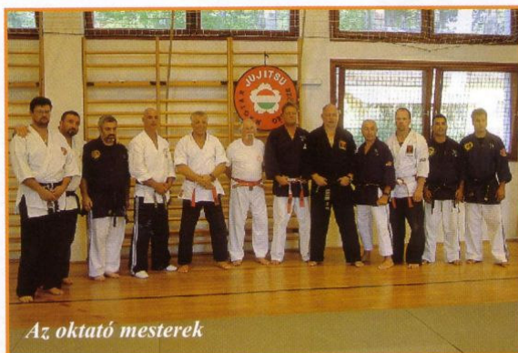
Az oktató mesterek