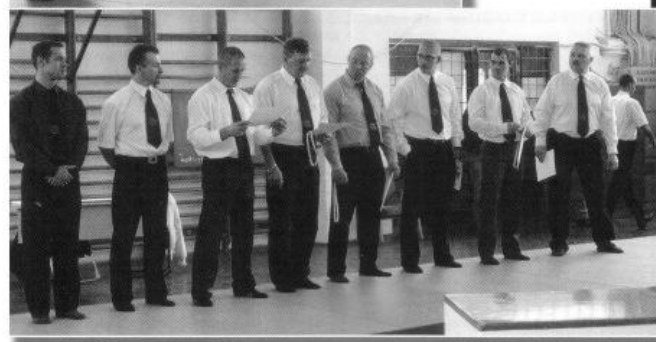
A teljes stáb