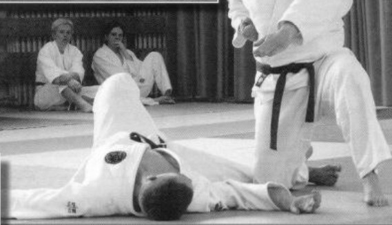
Meg ne mozdulj!