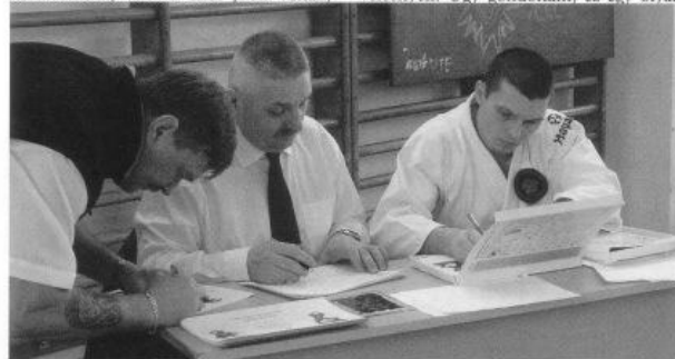
Es is fontos feladat

– Ez volt az első Magyar Kupa a szövetség megalakulása óta. A verseny kifejezetten technikai számokból állt, és úgy érzem, hogy felkészültségben nem okoztak csalódást az indulók. Külön vettük a kezdőket, a haladókat, a középhaladókat, és a mesteri fokozattal rendelkezőket. Őszintén megvallva több versenyzőre számítottunk, viszont akik jelen voltak.