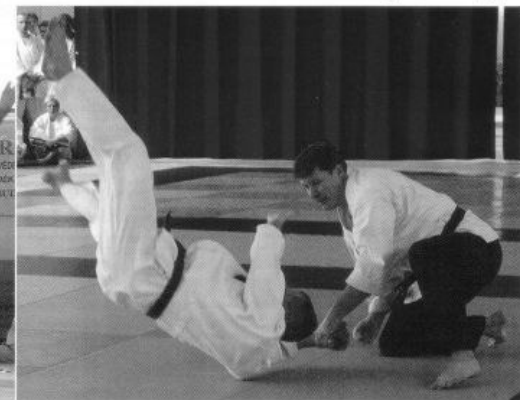
Csak azért foglak, el ne repülj!