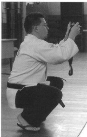
Nem csak én fotóztam!

A szervezetségen látszott, hogy tapasztalattal és sok munkával készültek az eseményre, mely a gyors megnyitó után két páston pörgösen haladt. A jitsukák önvédelem, fegyveres önvédelem és páros küzdelem versenyszámban, négy kategóriában mérték össze tudásukat. A versenyzők fegyelmelzeten mutatták be gyakorlatait, a bírók tapasztalattal, korrekt módon értékelték. A rangadónak nem