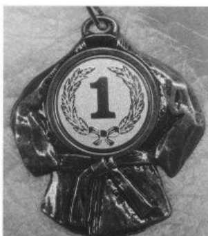
Az elismerés jelképe

Lelkes csapat érkezett Március 19-én, az UTE sportcsarnokba, arra a versenyre, melyet a Magyar Sport-jitsu Szövetség szervezett a különböző ju jitsu irányzatok felnőtt versenyzői részére. Szinte valamennyi magyarországi ju jitsu szervezet vezetője megkapta a meghívást, ennek ellenére nem telt meg a csarnok.